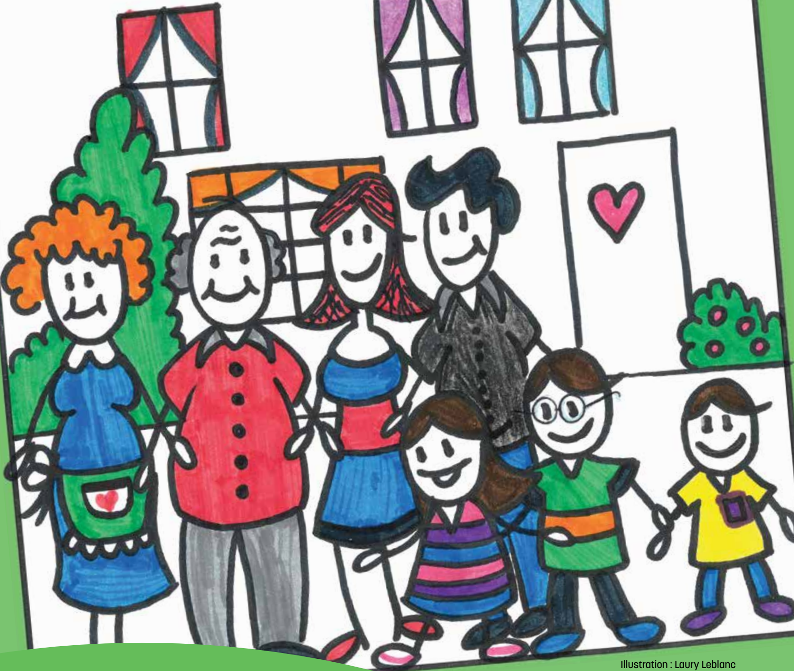
Illustration : Laury Leblanc