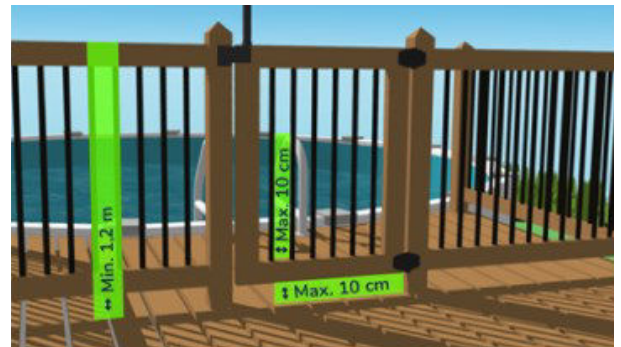
Dimensions exigées pour une enceinte.

Tout plongoir doit être installé conformément à la norme BNQ 9461-100 en vigueur au moment de l'installation.