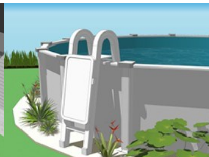
Exemple d'une échelle munie d'une portière de sécurité.