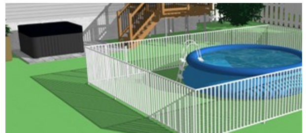
Exemple d'une piscine démontable de moins de 1,4 mètre de hauteur devant être entourée d'une enceinte.