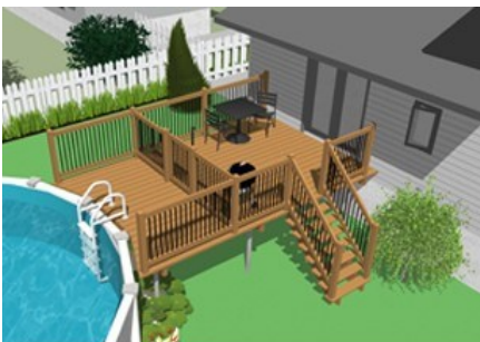
Exemple de terrasse rattachant la piscine à la résidence. La partie ouvrant sur la piscine est adéquatement protégée par une enceinte.