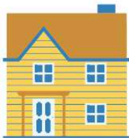
Respectez la consigne de rester à la maison