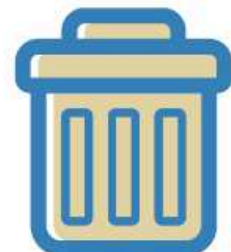
Jetez vos mouchoirs