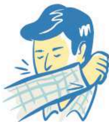
Toussez dans votre coude

Si vous éprouvez de l'anxiété ou des signes de dépression : Appelez le 811