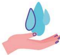
Lavez vos mains